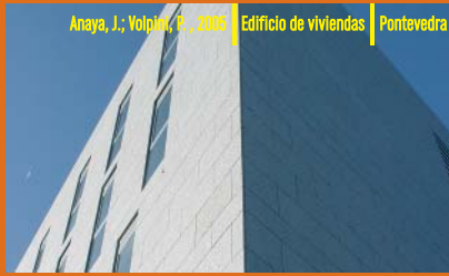
Anaya, J.; Volpik, E., 2008 | Edificio de viviendas | Pontevedra