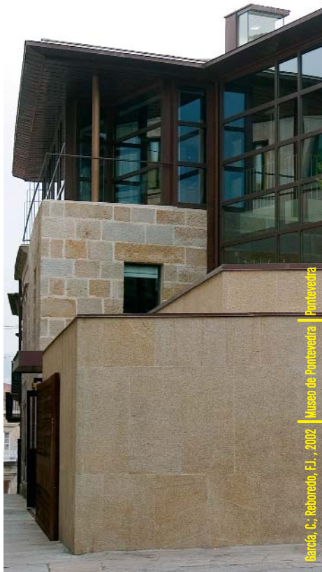
García, C., Reborado, F.J., 2002 Museo de Pontevedra (Pontevedra)